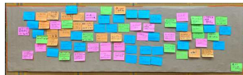
R6.08.01 未来共創ビジョンワークショップ掲示板 (モニターウォール)からの声

まちキャンプ、お散歩・ ジョギング・ドッグラン コース、お花畑や農園づ くり、収穫祭を楽しむ