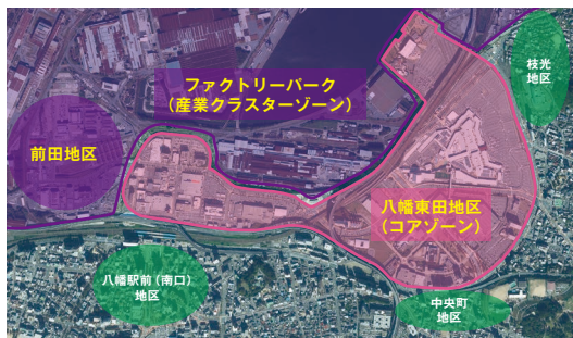
検討対象エリア：八幡東田地区（コアゾーン） および前田地区・ファクトリーパークゾーン

これからのまちづくりに取り組んでいくにあたり、これまでの足跡を振り返ると共に、多様な志民の皆さんとの対話を通じてその声や想いを積み重ね、「アクションベースド・ビジョン」として策定しました。今を生きる私たちが、一人ひとりの想いや志の実現に向けて、この地で一步踏み出すための灯となるようなビジョンに育てていきたいと思えます。