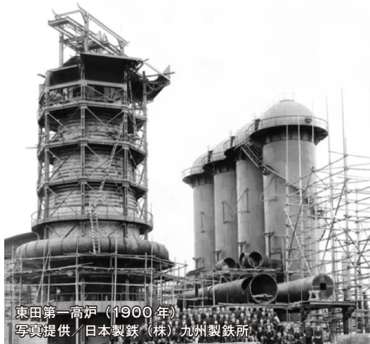
東田第一高炉（1900年）

福岡県北九州市の中心に位置する八幡東田地区は、1901年の官営八幡製鐵所操業開始以来、我が国の産業革命発祥の地として20世紀の扉を開いた歴史ある街であり、1990年代より官民連携で新たなまちづくりに着手、先進的な都市基盤の整備や職・住・学・遊の高度な都市機能の導入を進め、次世代を担う産業・ビジネスが集積し、年間来街者2千万人超を迎える都市拠点に進化してきました。