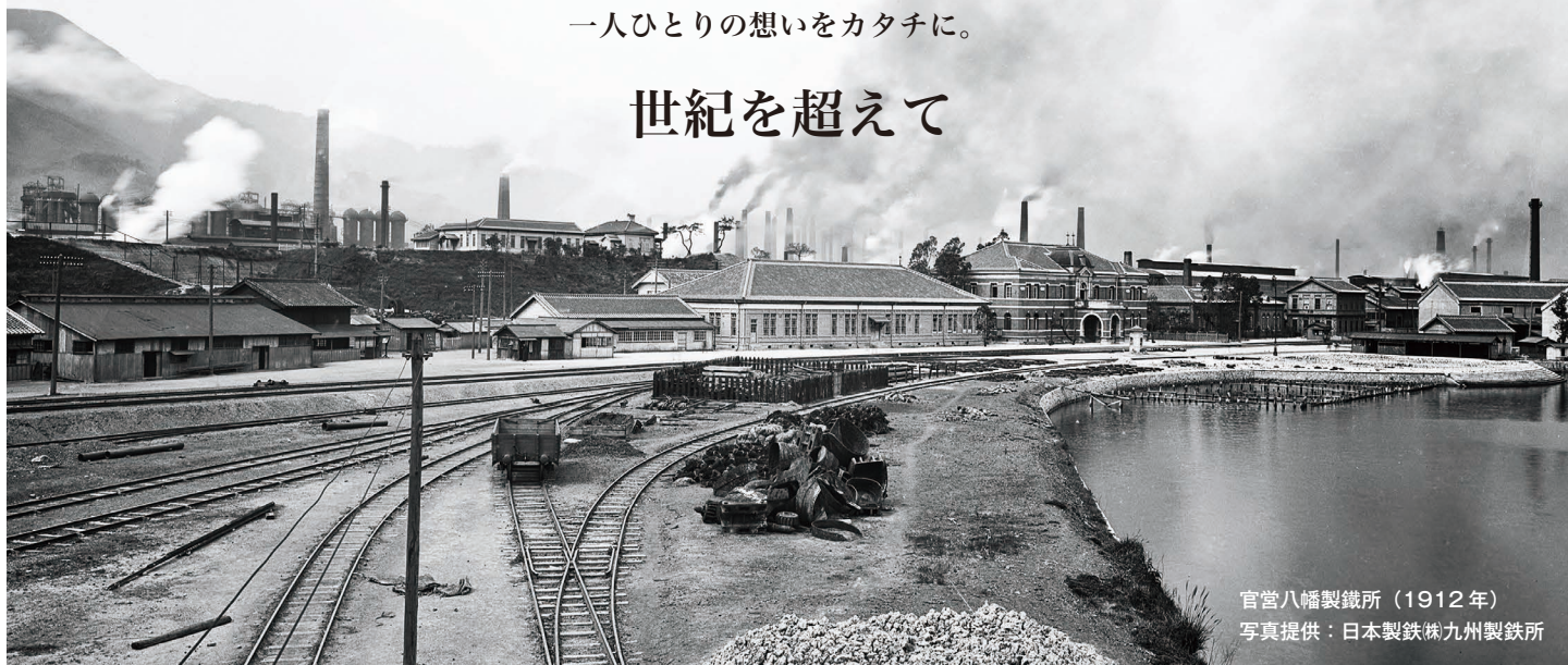
官営八幡製鐵所（1912年）